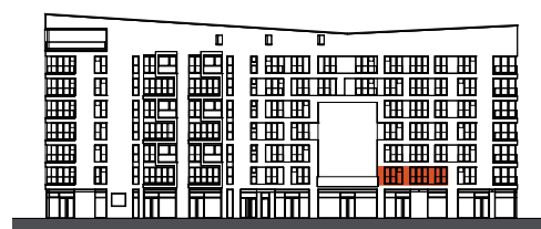
Ansicht von Osten